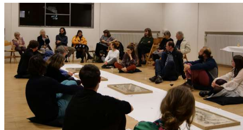
© Anne Laroze, far° Nyon 2023

Le livre et le processus artistique antérieur ont fait l'objet de l'émission « L'Art est la matière » lors d'une conversation entre Thierry Boutonnier et Paul Ardenne, émission diffusée sur France Culture en février 2023.