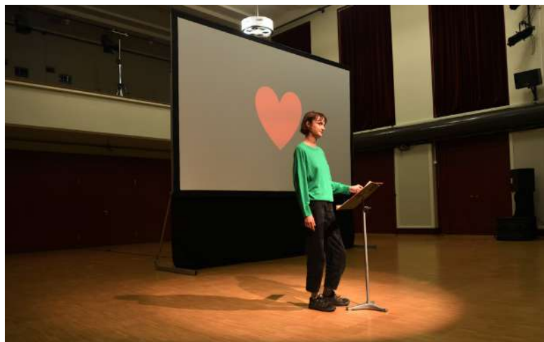
Faire troupeau © Arya Dil, far° Nyon 2023

Mise au concours, cette résidence était réservée aux jeunes artistes francophones n'ayant pas plus de 5 ans d'expérience dans l'écriture dramatique. Le projet devait s'ancrer, d'une manière ou d'une autre, dans la région de Nyon et placer, en son centre, une expérience minoritaire (classe, genre, racialisation, etc.).