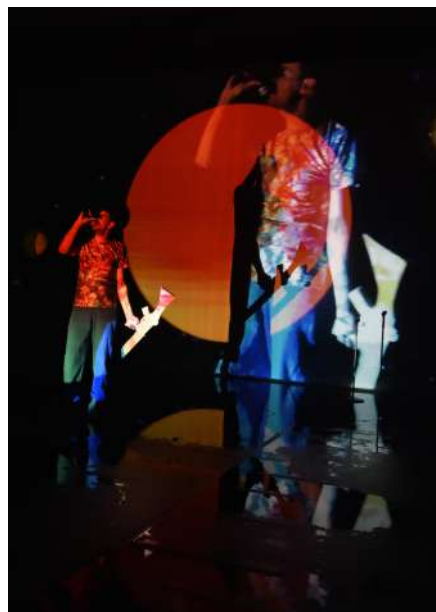
Zona de derrama je suisse (or not) des héros