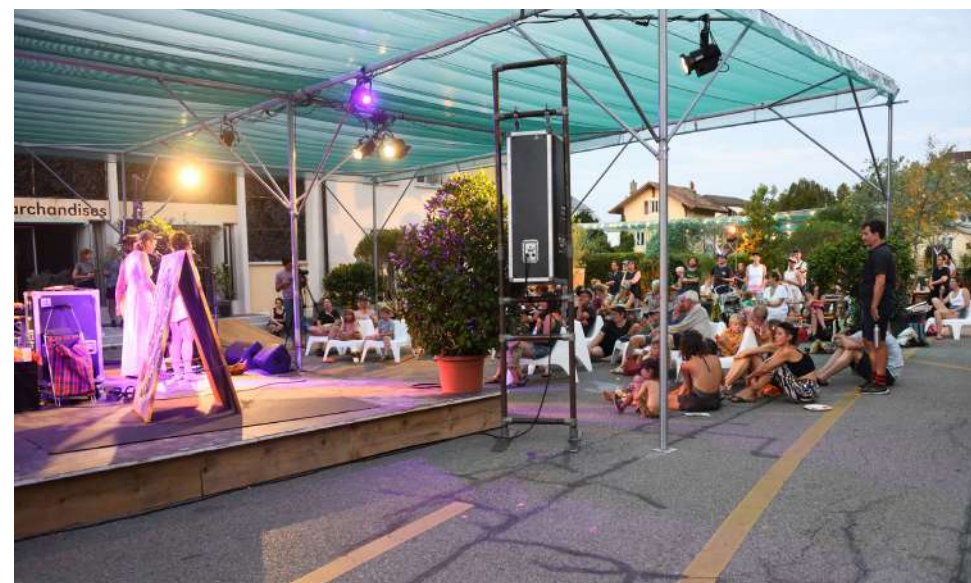
Concert du groupe genevois Alice ©Arya Dil, far° Nyon 2023

En 2023, le far° a offert une place de choix à la musique live en organisant 4 concerts en plein air ainsi que 2 soirées festives animées par des DJs dans la Cour des Marchandises. 600 personnes ont pu profiter de la musique des groupes suisses Roshâni, Alice et Milla Pluton ainsi que des sonorités ougandaises de l'artiste Otim Alpha en tournée européenne. Les soirées DJs ont rencontré un beau succès : le collectif nyonnais Club Katel a réuni environ 200 personnes pour la fête d'ouverture du far°. Près de 250 personnes se sont également regroupées autour des performeuses brésiliennes Marara Kelly et Cigarra pour la fête de clôture. Dans le but d'encadrer au mieux ces soirées, le far° a signé la charte ARETHA, de l'association fribourgeoise Mille Sept Sans, engagée dans la sensibilisation et la prévention de violences sexistes et sexuelles dans l'espace public. Lors d'une matinée en amont du festival, l'équipe élargie du far° a bénéficié d'une formation donnée par l'association afin de pouvoir assurer la transmission des valeurs de respect, de convivialité et de coveillance auprès de l'équipe du festival, des équipes artistiques et des festivalier·ère·x·s.