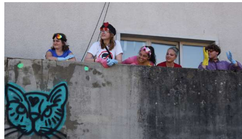
Dream Teen, Série dicule