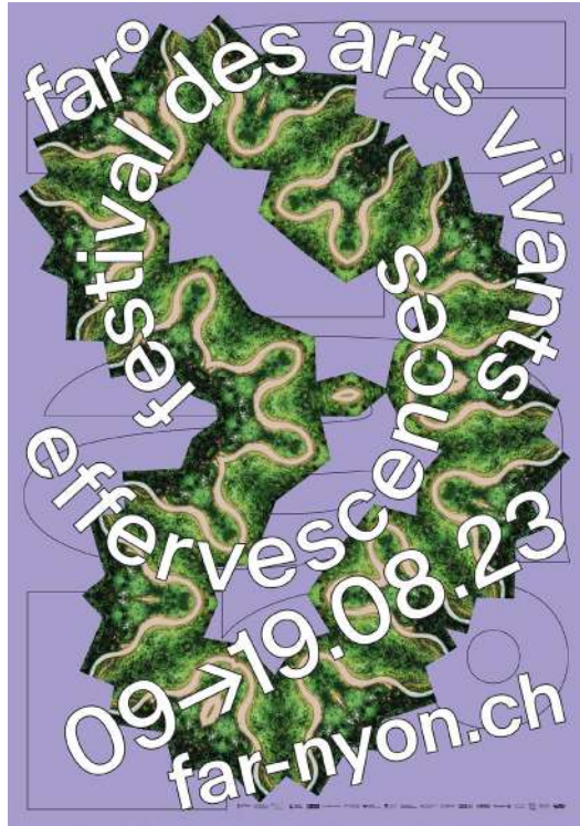
Visuels des affiches la 39 e édition, © WePlayDesign